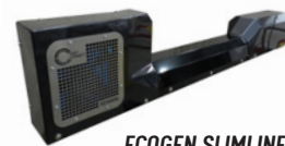
ECOGEN SLIMLINE 30 Funktionell design kombinerad med stora bränslebesparingar.